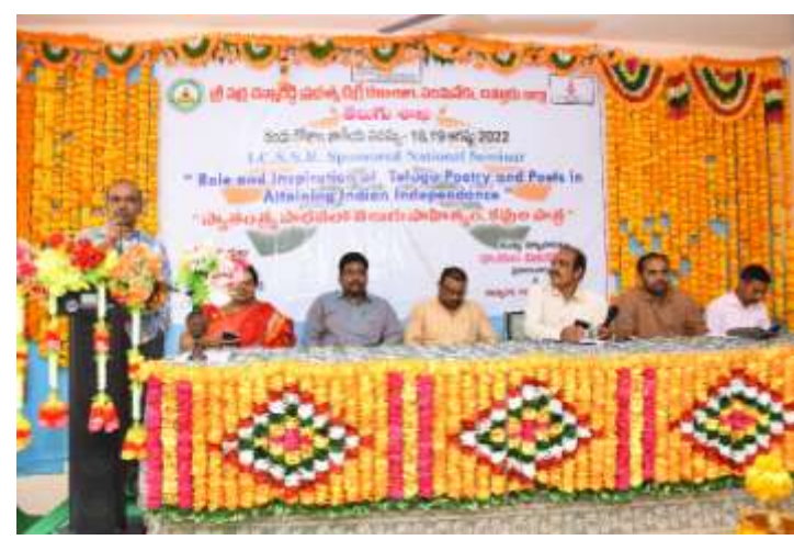
Releasing the Seminar proceeding by the Guest of Honours