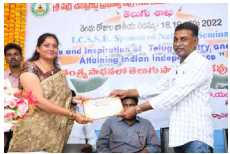
Distribution of Certificates