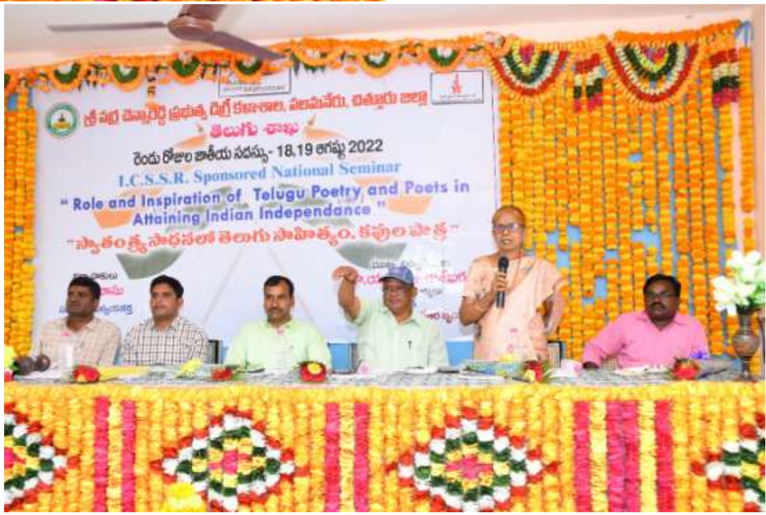
Adders by the Guest Dr.R.Krishnaveni