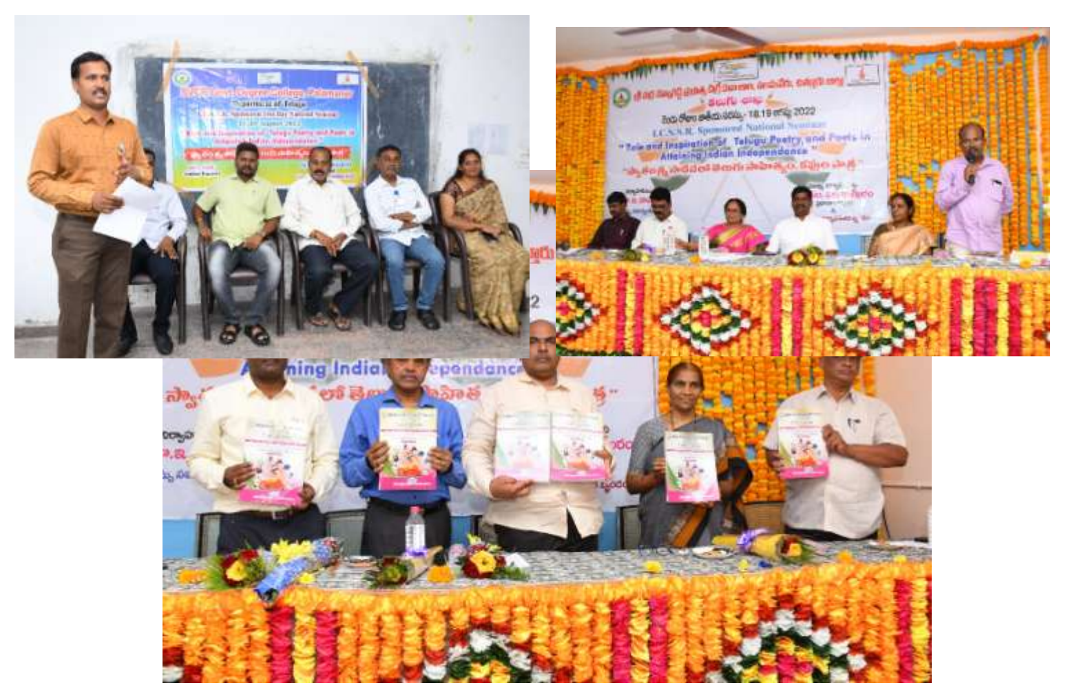
Paper Presentation in the Sessions